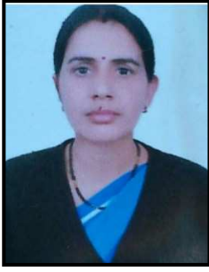
आचार्य निलम (अ.) रा.उ.प्रा.वि. कच्छावतान तारानगर