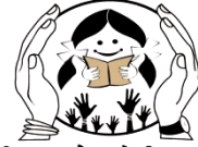
बेटी बचाओ - बेटी पढ़ाओ Beti Bachao - Beti Padhao

सौजन्य :- जि.शि.अ. प्रारम्भिक शिक्षा विभाग, चूरु (राजस्थान)